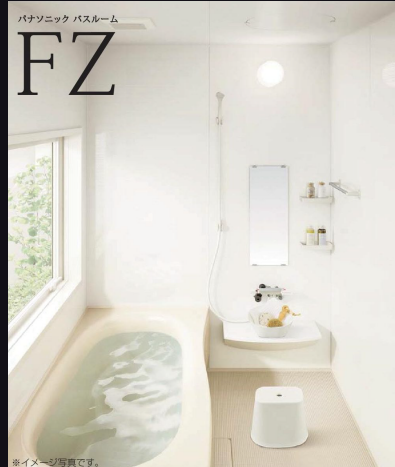
※イメージ写真です。