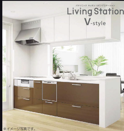
※イメージ写真です。