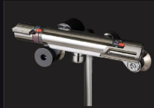
メタルハンドル ストレート壁付水栓