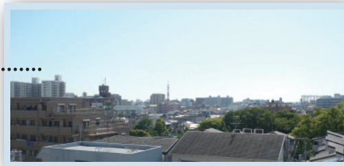
バルコニーから眺める景色

■所在地/大阪市東淀川区小松 4 丁目 16 番 43 号 ■交通/地下鉄今里筋線「瑞光四丁目」徒歩約 6 分・阪急京都線「上新庄」徒歩約 13 分 ■専有面積 / 70.08 m 2 ■バルコニー面積 / 12.1 m 2 ■構造 / 鉄筋コンクリート造陸屋根 7 階建 ■築年月 / 平成 23 年 2 月 ■間取り / 3LDK ■バルコニーの方向 / 西 ■管理費・修繕積立金 / 8,500 円・9,500 円 ■現況 / 空家 ■引渡 / 即時 ■取引形態 / 仲介