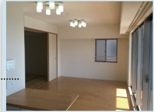
和室と繋がる、広々としたリビング・ダイニング